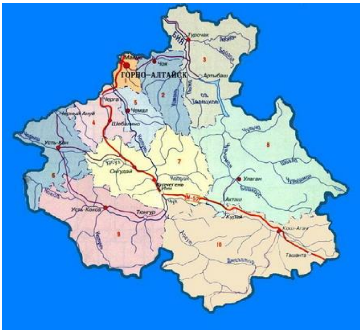
Карта Республики Алтай.