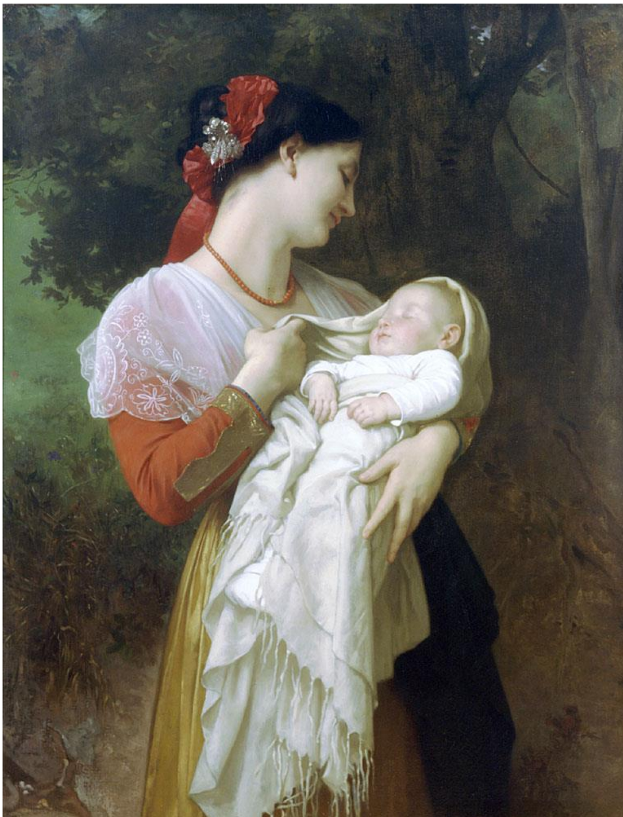
Адольф Вильям Бугро. «Материнское счастье».