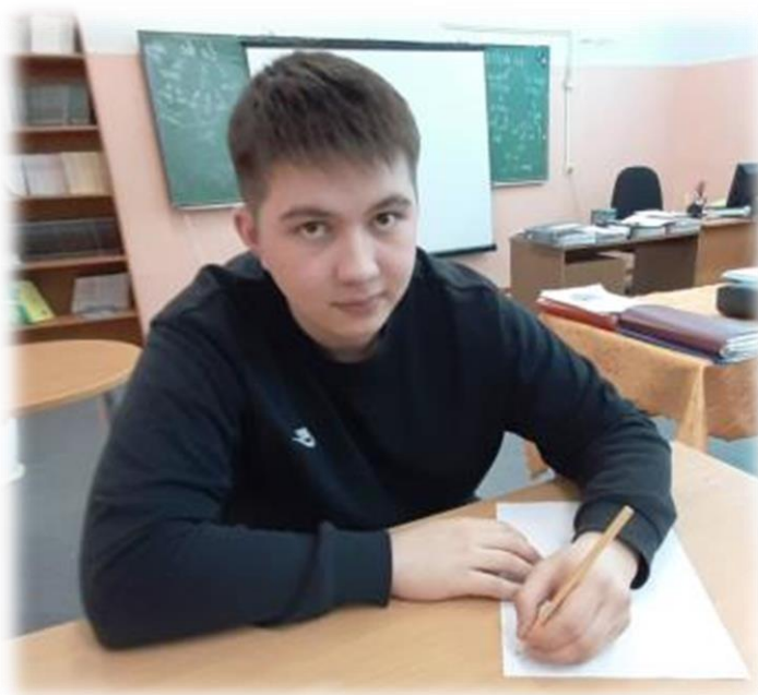
Фото 5. Карандаш — это универсальный пишущий инструмент

Карандаш — это универсальный пишущий инструмент. Его можно использовать даже тогда, когда ручка может подвести. С помощью карандашей можно делать зарисовки прямо под водой или в невесомости, он также устойчив к сложным погодным условиям, таким как холод или жара. Поэтому карандаши популярны среди аквалангистов, космонавтов, а также среди ученых на станциях Северного и Южного полюса.