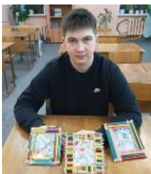
Фото 7. Рамка для фото из карандашей

Мы подарили карандашам «вторую жизнь» сделали рамки для фотографий