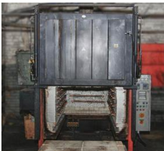
Фото. 1. Печь для обжигания

Смешанный с глиной графит хорошо просушивается, затем спрессовывается в виде длинных тонких палочек и обжигается в печи.