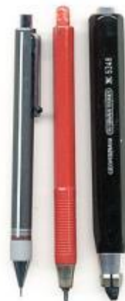
Фото. 2. Современные карандаши

Идея его проста. Чем каждый раз затачивать карандаш деревянный, проще поместить графитовый стержень внутрь корпуса, используя для его фиксации механический держатель. Когда графитовый стержень стачивается, его выдвигают на нужную длину. В то же время длина пишущего инструмента остается постоянной.