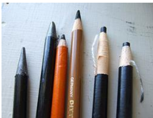
Фото 3. Специальные художественные карандаши

Кроме того, карандаши бывают школьными, канцелярскими, чертежными, рисовальными. А по принадлежности их относят к одной из следующих групп: чернографитные, химические и цветные [1].