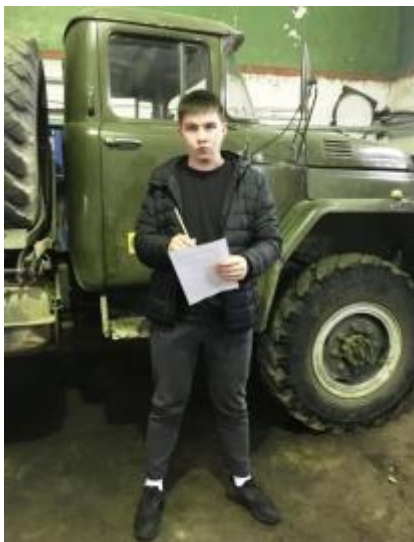
Фото 8. В профессии «Техник механик» тоже не можем обойтись без карандаша

Карандаш – самый удобный инструмент для письма. Карандаши берут с собой аквалангисты, чтобы делать зарисовки под водой. На них не оказывает губительного влияния даже невесомость и мороз. Так что в космосе и на полярных станциях без карандашей никак не обойтись, и мы в своей профессии «Техник механик» тоже не можем обойтись без карандаша.