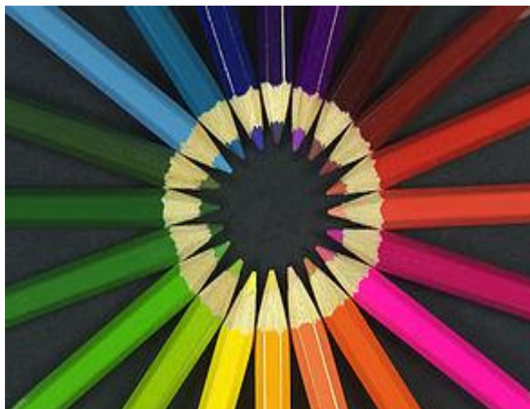
Фото 4. Цветные карандаши

Цветному карандашу графит не нужен. Стержень его состоит из глины, красителя, клея, пропитан жиром.